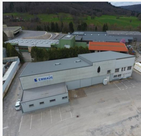
700 m 2 de panneaux photovoltaïques devraient être installés sur le toit du bâtiment Emmaüs.

Les deux promesses de bail ont été signées. La première concerne un projet « emblématique » pour la Fruitière selon le président Yves Monnot. La société va installer pour son compte une centrale photovoltaïque sur le toit de l'extension de l'école de Chay. Le permis de construire est en cours d'instruction.