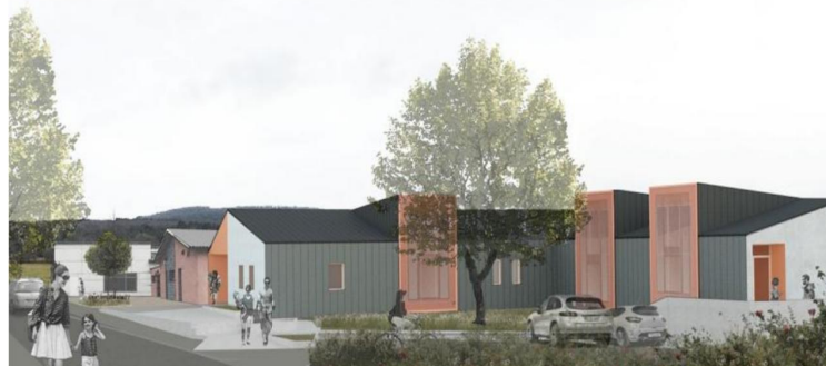
La future école de Chay et son projet de centrale photovoltaïque sur toit.

Avril-mai 2018. Lancement de réunions TupeWatt « afin d'informer et d'associer les habitants du territoire Loue-Lison et alentours à la démarche ». Prochains rendez-vous le 15 mai à 20 h 30 en mairie de Malbrans, le 22 mai à Ornans et le 29 mai à Amancey.